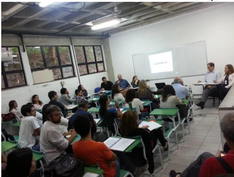
Mesa-Redonda realizada na UNIRIO em setembro

Em setembro de 2013 o Conselho Nacional de Arquivos (CONARQ) disponibilizou para Consulta Pública proposta de Projeto de Lei que altera, revoga e acresce novos dispositivos à Lei nº 8.159, de 8 de janeiro de 1991 (conhecida como Lei de Arquivos), que dispõe sobre a política nacional de arquivos públicos e privados e dá outras providências. Essa proposta fora apresentada para análise nas 71ª e 72ª Reuniões Plenárias do CONARQ, realizadas em agosto.