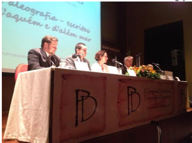
Abertura do II CBPD, no Arquivo Nacional

Como realizado todos os anos, como prestação de contas aos associados e à comunidade arquivística, apresentamos as ações desenvolvidas ao longo de 2013 pela AAERJ.