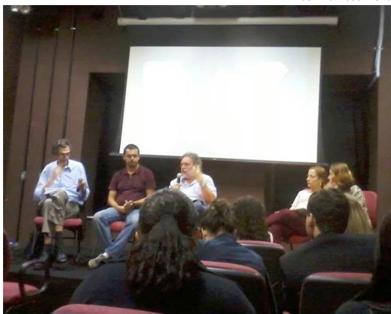
Encontro realizado em outubro na UFF